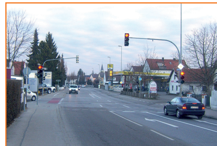
Fußgängerampel in der Münchener Straße