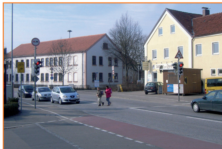
Fußgängerampel in der Münchener Straße